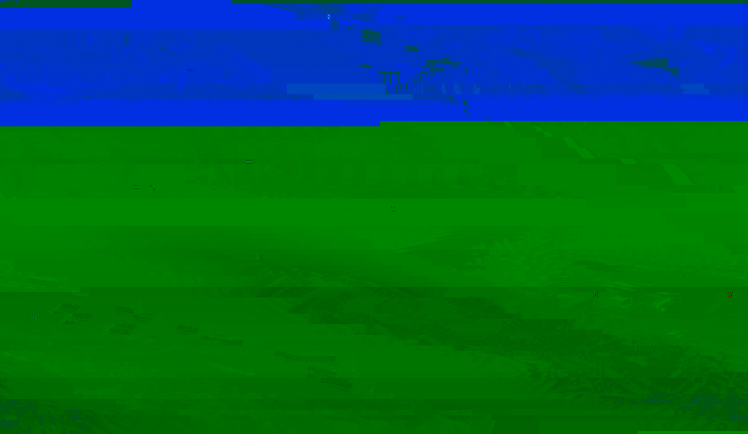
半导体工厂 Semiconductor Factory