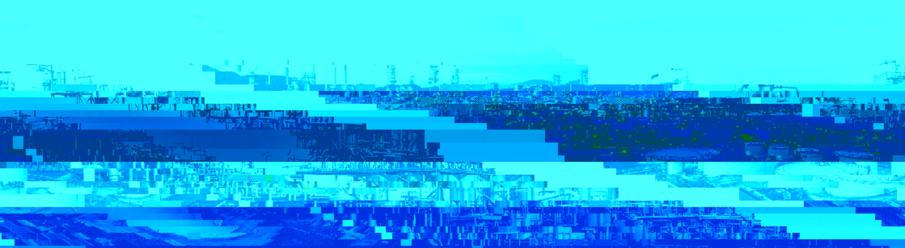
油厂 Oil & Gas Refinery